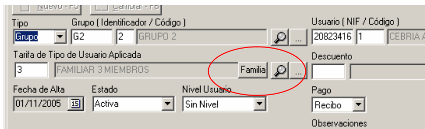
Figura 2. Lanzar selección de integrantes en una inscripción familiar.

Una inscripción familiar únicamente se podrá realizar a un “cabeza de familia”, este será el titular de la inscripción y todos los recibos estarán a su nombre.